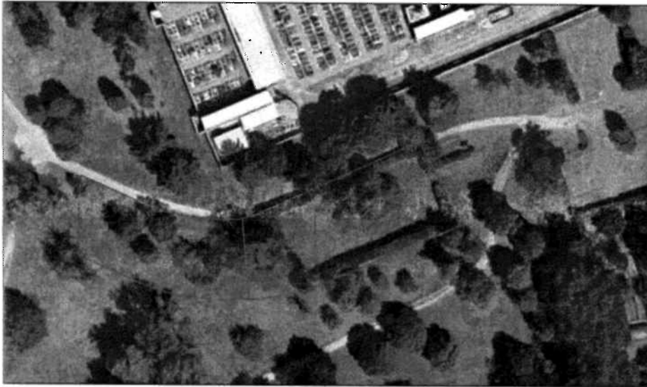
AREA CANI – INQUADRAMENTO TERRITORIALE