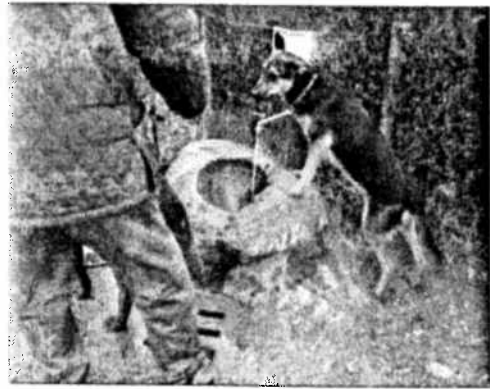
AREA CANI – ESEMPIO FONTANELLA