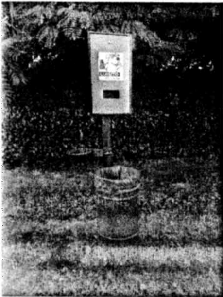
AREA CANI – ESEMPIO CESTINO RACCOLTA DEIEZIONI CON PORTA SACCHETTO IGIENICO