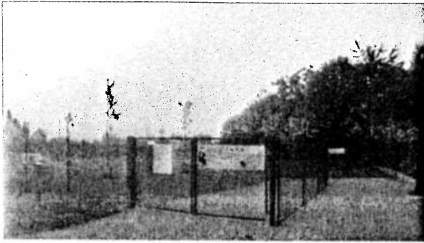
AREA CANI – ESEMPIO INGRESSO E RECINZIONE